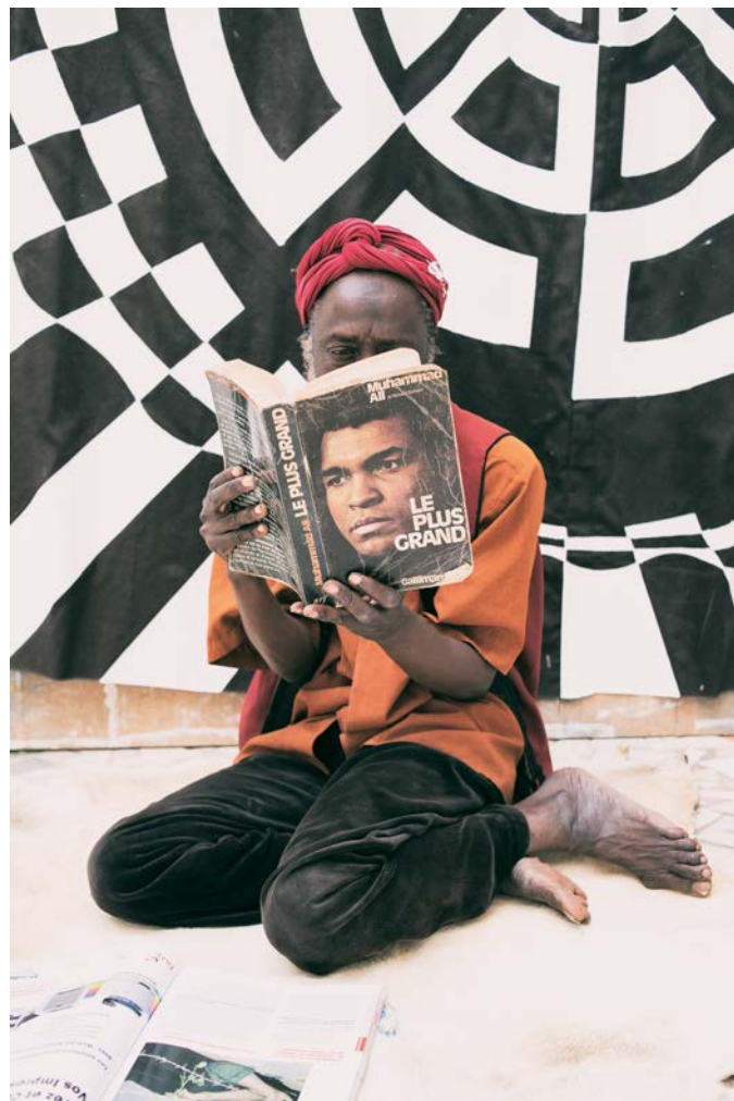
Sans titre (from the series Nothing's in Vain, 2014-2016) Courtesy of the artist

Plusieurs expositions thématiques viendront compléter le programme : une attention particulière est accordée aux pratiques collectives afin de traiter la possibilité de créer des communautés complémentaires. Un aperçu complet des expositions complémentaires sera disponible prochainement.